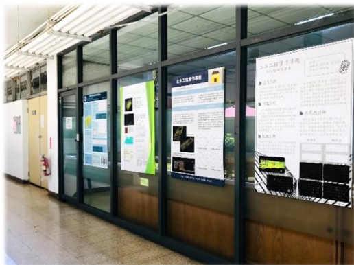
各組成果發表展出