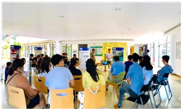
各組成果發表展出